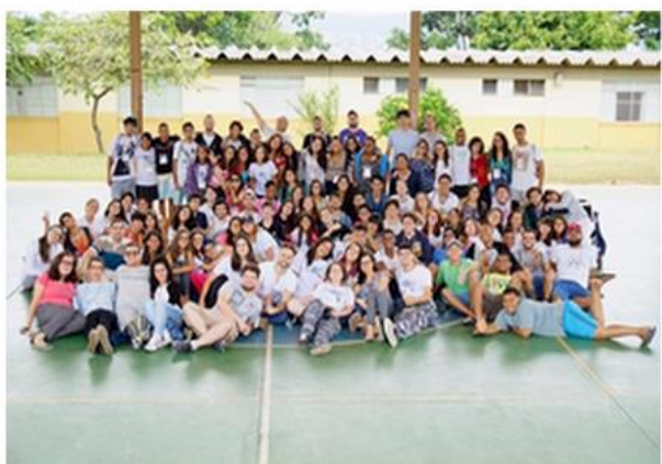
Edição 2017 - Regional Centro-Sul