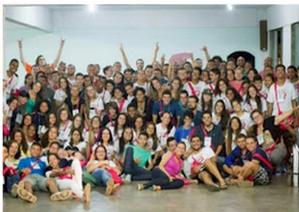
Edição 2016 - Regional Noroeste