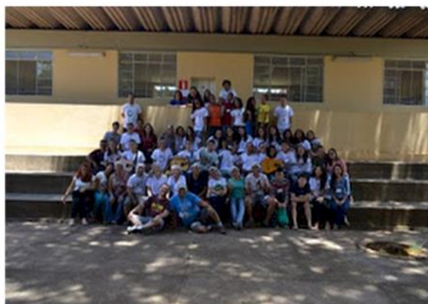
Edição 2016 - Regional Sudeste