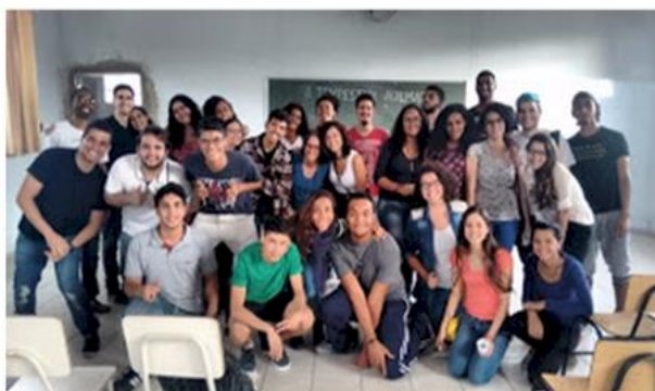
Edição 2016 - Regional Nordeste