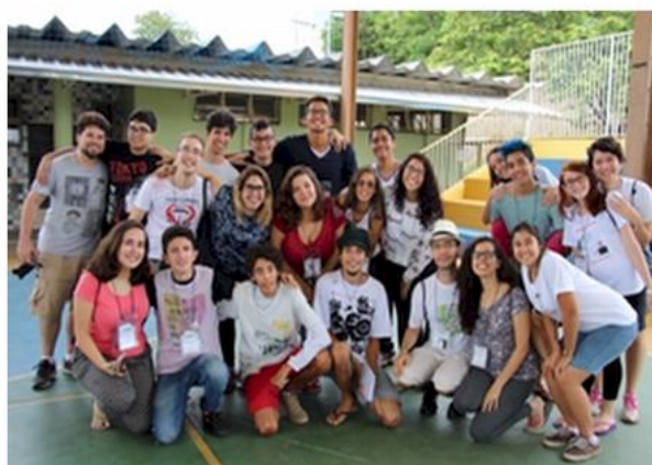
Jovens da Mocidade participantes da COMEBH 2017