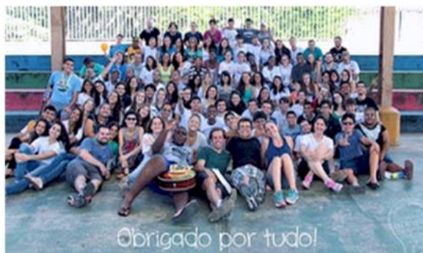
Edição 2016 - Regional Centro-Sul

Em 2017, 450 jovens participaram dos encontros no período do Carnaval. Mais uma vez, nossos jovens da Mocidade AECX marcaram presença na COMEBH: havia pelo menos 1 jovem da Mocidade AECX em cada comissão organizadora. Além disso, vários novatos tiveram a oportunidade de mergulhar neste encontro maravilhoso, ampliando seu grupo de amizades, aprofundando seus estudos sobre a Doutrina Espírita e, mais importante, instrumentalizando-se para promover sua transformação individual.