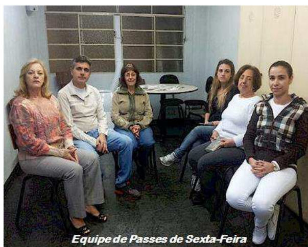
Equipe de Passes de Sexta-Feira