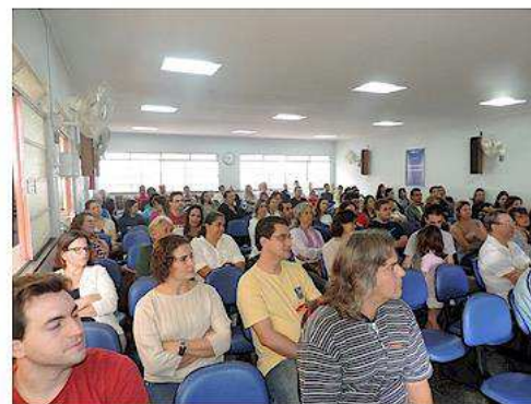
Encerramento dia 9 – Reunião de Pais