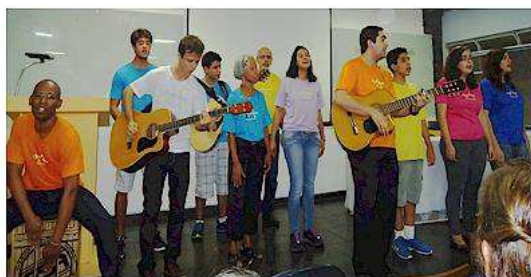
Abertura dia 4 Grupo Asas