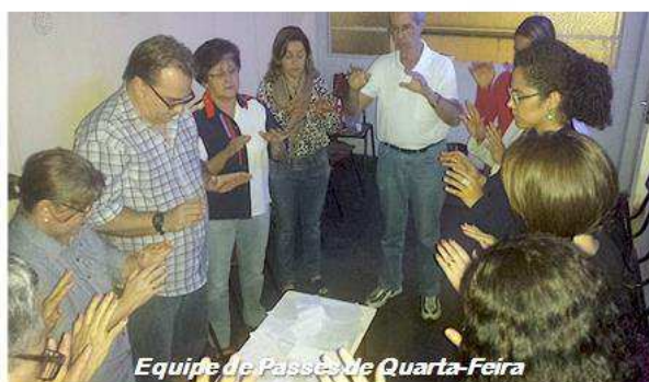
Equipe de Passes de Quarta-Feira