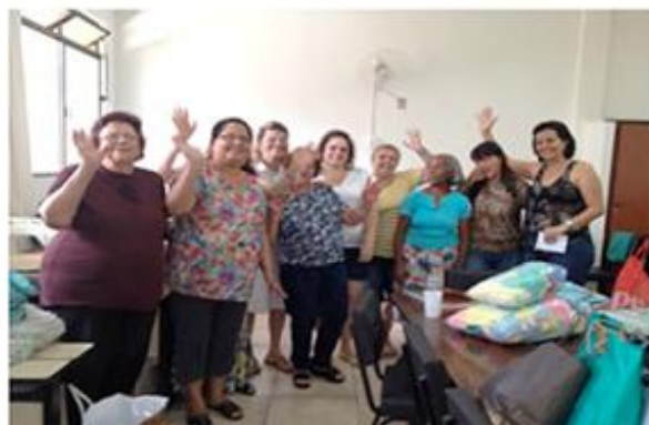
Equipe de Confeção do Enxovalzinho