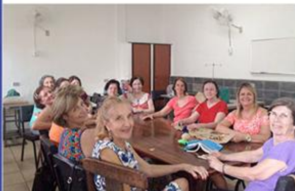
Equipe do Bazar