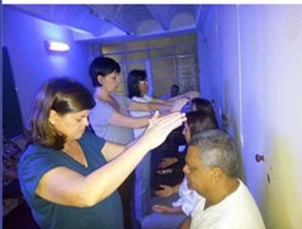
Passé Atendimento Fraternal