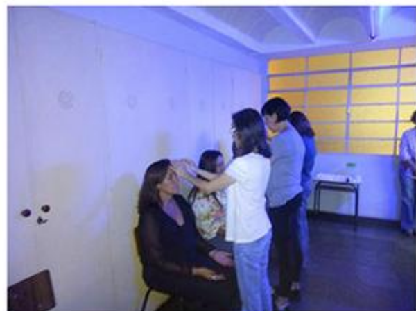
Passé Atendimento Fraternal